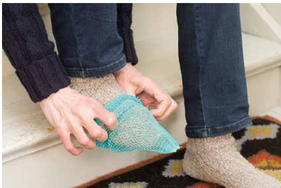
Sukkien päälle tai paljaisiin jalkoihin voi laittaa liukuestesukat.

Sähköiset versiot voi lukea osoitteessa: www.ikateknologiakeskus.fi/julkaisut/oppaat