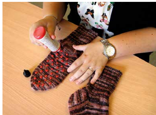
Liukuesteet voit lisätä myös itse liukuestetipoilla.