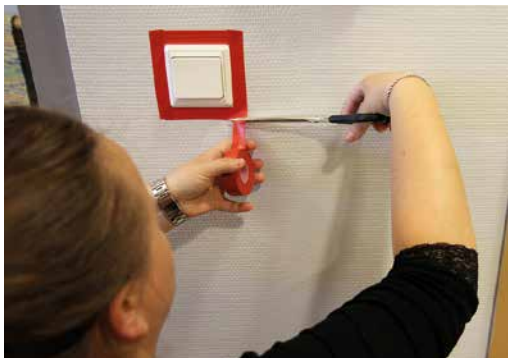
Punaisella teipillä voi korostaa valokatkaisimia ja muita tärkeitä paikkoja.

Hahmottamista voi helpottaa erilaisilla keinoilla. Tiettyjä paikkoja voi osoittaa tai korostaa kontrastivärien avulla. Tehokkain kontrasti saadaan, kun laitetaan punaista väriä, esimerkiksi teippiä, valkoiselle pohjalle.